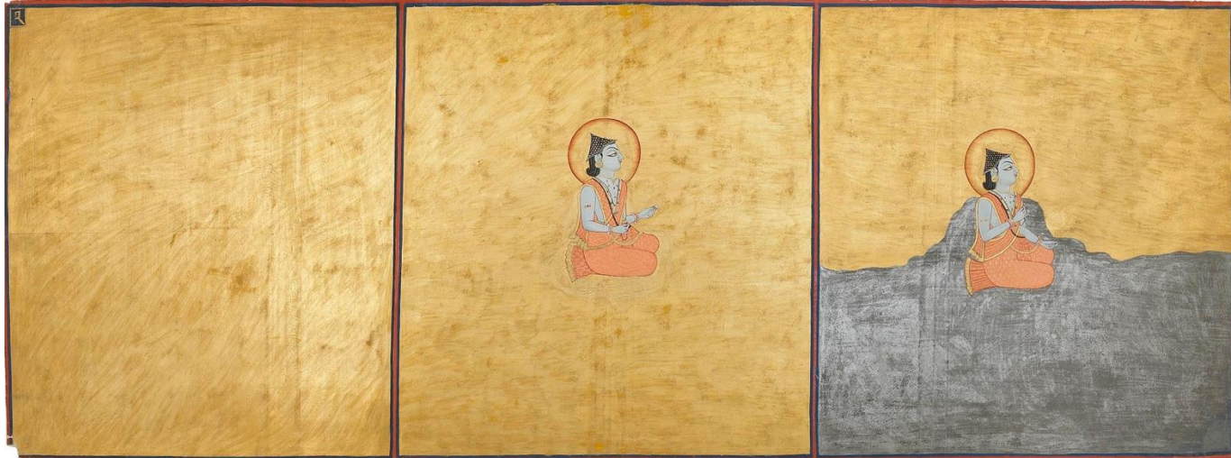
Three Aspects of the Absolute, Nath Charit, 1880